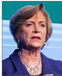
La alcaldesa de Providencia, Evelyn Matthei .

En la UDI, de todos modos, temen que las aristas del caso puedan afectar su popularidad y sean utilizadas en su contra por el oficialismo para desacreditar a su sector. Sus cercanos, en cambio, creen que su popularidad está basada en sus atributos y capacidad de gestión, por lo que no debería ver una merma a partir de este caso en los próximos meses.