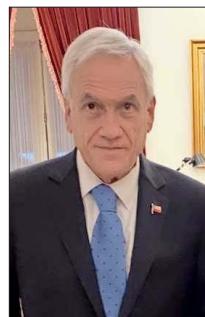
El expresidente Sebastián Piñera .