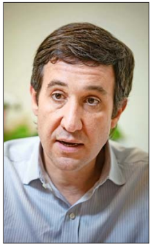
El diputado Guillermo Ramírez , presidente de la UDI.

Para la UDI, los últimos meses han sido complejos. La intempestiva renuncia de Javier Macaya como presidente del partido, luego de la polémica que generaron sus declaraciones frente al caso de su padre (condenado por abuso sexual de menores), obligó a rearmar la directiva en tiempo récord.