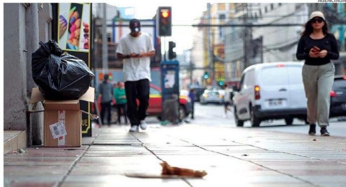
COMERCiantes y RESIDENTES DEL SECTOR CENTRO CRITICAN ESTADO DE ASEO DE CALLES DEL CASCO HISTÓRICO.

“Quizás como las autoridades no vienen para acá, no se enteran de lo que pasa”, dice una mujer que transita con bolsas de supermercado al referirse al declive del sector. Una imagen que corrobora el mobiliario público destruido hace meses, según comentan en la Plaza Sotomayor de Antofagasta, como lo evidencian bancas de concreto instaladas frente al Mercado Central. Perros