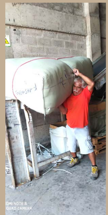
IDMI NOTE 8 QUAD CAMERA

Esa es otra tarea y otra lucha que nos espera, la que seguiremos dando porque nos vamos a preparar para dar esa pelea que se viene.