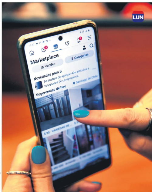
En redes sociales, Marketplace de Facebook es la app más utilizada para ventas informales.

“El comercio nacional por Internet, que no tiene iniciación de actividades, o sea es informal, usa principalmente Marketplace, como el de Facebook, porque es una venta menos visible para la fiscalización. Lo otro que se usa mucho dentro de las redes sociales, es la venta directa a grupos de personas a través de WhatsApp”, dice el experto.