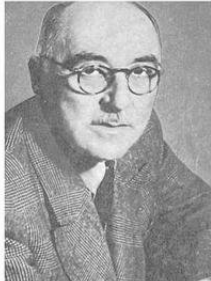
EL ESCRITOR EDUARDO BARRIOS ADMINISTRÓ EL FUNDO LA MARQUESA.

Más tarde, en 1948, Barrios publicó “Gran señor y rajadiablos”, con el que marcó un hito, ya que esta novela que narra vivencias y leyendas del campo chileno, especialmente de las localidades de Huinca, Cuncumén y alrededores de Melipilla, circuló en Chile, México y Brasil de manera simultánea, lo que fue todo un éxito con