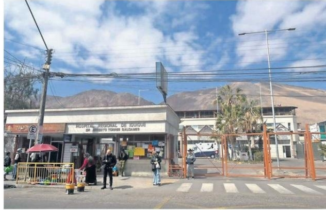
FUNCIÓNARIOS MÉDICOS DEL HOSPITAL DE IQUIQUE CRITICAN EL FUNCIONAMIENTO DE LA RED.

"La gestión de la directora de salud se lo hicimos saber y no nos convence, porque hemos tenido tres reu-