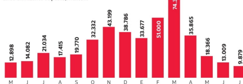
Evolución de la pérdida bruta mensual por fraude externo Cifras en millones de pesos, mensual