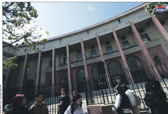
Según Cadem, la Facultad de Derecho de la U. de Chile es la más prestigiosa de Chile junto a la de la PUC.