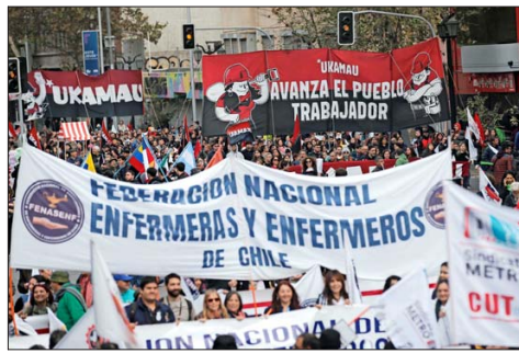
El número de personas en Chile que participa en sindicatos activos asciende a 1.224.686.

En términos regionales, se observa que en dos zonas la sindicalización es menor al 10%: Coquimbo (8,9%) y El Maule (9,2%). En La Araucanía, la tasa llega al 10,9%. Es decir, en esas regiones, alrededor de uno de