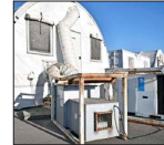
El recinto fue instalado durante la pandemia, en los estacionamientos del Estadio La Portada.

Hospital modular de La Serena lleva siete meses sin uso ni ser desarmado | 7