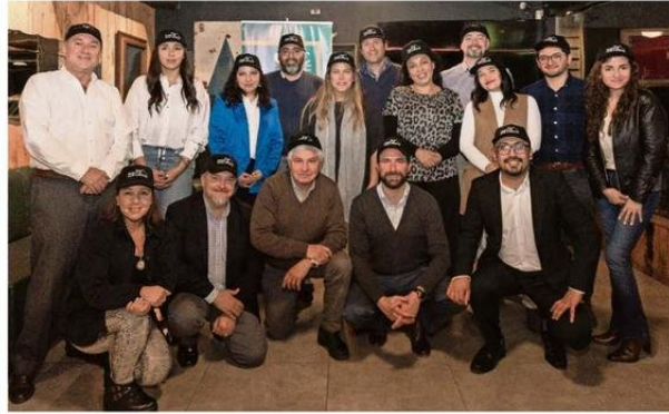
▲ Asistentes de La Ruta del Talento para Chile y equipo OTIC.