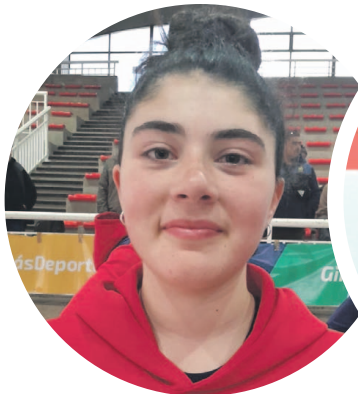
Trinidad asegura que la clave del título del Colegio Santa Teresa a nivel regional, es que la mayoría de las jugadoras juega habitualmente en clubes y conocen de memoria su juego.