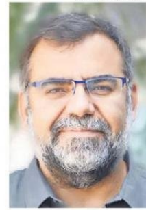
ACADEMIA DE CIENCIAS BAEZA ES INGENIERO CIVIL.

El experto, destacado a nivel internacional por su aporte en las disciplinas de