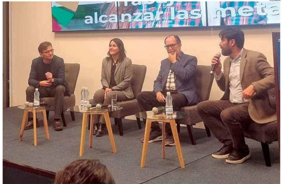
EL INFORME FUE PRESENTADO EN EL AUDITORIO DEL MERCURIO DE ANTOFAGASTA.

Sin embargo, el académico alerta sobre los puntos críticos para la región, puntualizando