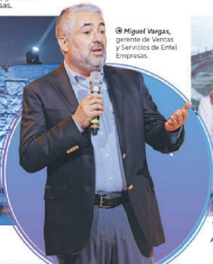
© Miguel Vargas, gerente de Ventas y Servicios de Entel Empresas.