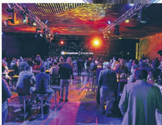
© El evento que combinó tecnología, astronomía, música y networking.