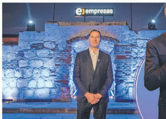
© Andrés Salvador, gerente de División Corporaciones de Entel Empresas.