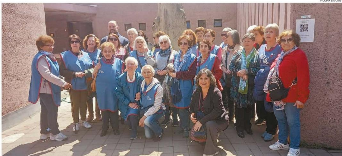
FUNDADA POR EL SACERDOTE JESUITA Y POSTERIOR SANTO, PADRE ALBERTO HURTADO, EL 14 DE OCTUBRE DE 1944.

personas en condición de calle, y 12% de la población vulnerable en esta región, son atendidas en Hogar de Cristo.