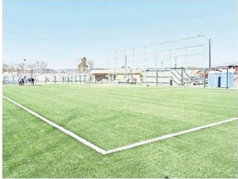
La recuperación de espacios en la comuna es algo que se viene haciendo hace tiempo, afirmó el dirigente

A lo anterior agregó que existen más espacios públicos a disposición de la comunidad, como