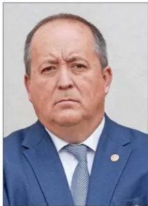
El fiscal nacional, Ángel Valencia.

Si bien especialistas advierten que la sola comunicación con el abogado no implicaría un delito, plantean que podría configurarse una causal de inhabilidad, dependiendo del contenido de la misma, y que por eso es clave conocer esas conversaciones. El Ministerio Público, en tanto, descartó eventuales solicitudes de favores y rechazó “cualquier tipo de amedrentamiento” a sus investigadores.