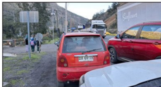
A la izquierda se aprecia a estudiantes esperando los furgones escolares, que no llegan por el taco.

- No, no hacen caso, ahí lo cantan tan bonito. En una mesa de la Bicomunal la Delegación nos presentó el Plan de Invierno para estos casos, pero no lo hemos visto funcionando. Yo no sé si la Municipalidad de Los Andes, la Delegación, hicieron uso de los abandonos de sus deberes con la ciudadanía porque ya es mucho tiempo de que no nos están 'pescando', a las reuniones mandan representantes; para la Bicomunal, la vez pasada el delegado no fue a la reunión y nadie de la Delegación fue, entonces yo no sé qué les está pasando a las autoridades, ahora menos que hay elecciones, que se van a volver a reelegir, deberían con mayor razón estar aquí en el camino, pero tampoco lo hacen. Yo no sé qué está pasando. Hay un abandono total de sus deberes con nosotros del Camino Internacional, somos más de 10 mil personas, no somos pocos. En el Camino