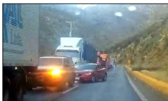
Una gran cantidad de vehículos se apodera del camino cuando se abre el Paso Los Libertadores.