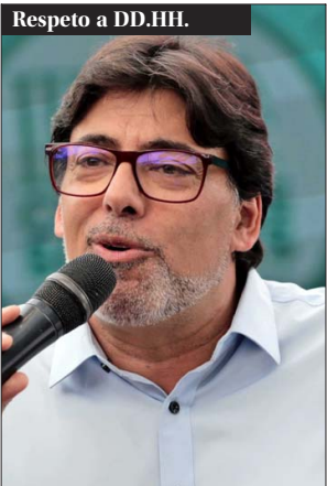
LAUTARO CARMONA PRESIDENTE DEL PC (EL DOMINGO 24 DE AGOSTO, 2024, EN TVN)

Respeto a DD.HH. "En este país (Venezuela), donde todos dicen que no hay separación de poderes, enterarnos y poder contarle al mundo que hay cientos de agentes del Estado condenados por violaciones a los DD.HH.".