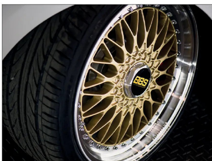
Las llantas BBS son de las más cotizadas del mercado.

detrimiento de los deportivos, que calzaban esta marca en sus ruedas.