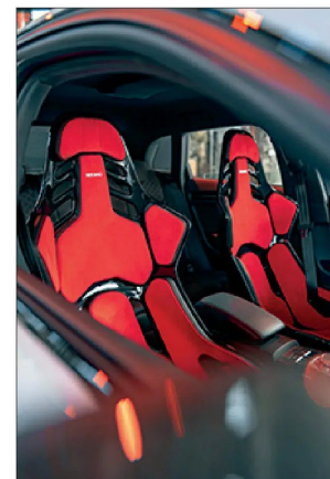
Recaro equipa autos de competición.

El problema se agudiza porque las principales líneas de negocios son las empresas,