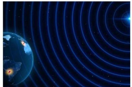
ILUSTRACIÓN QUE GRAFICA LAS OBSERVACIONES DEL EHT.

“A 0,87 mm (de resolución), nuestras imágenes serán más nítidas y detalladas,