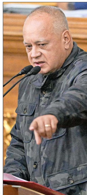
CABELLO ha criticado a quienes cuestionan el resultado de las elecciones.