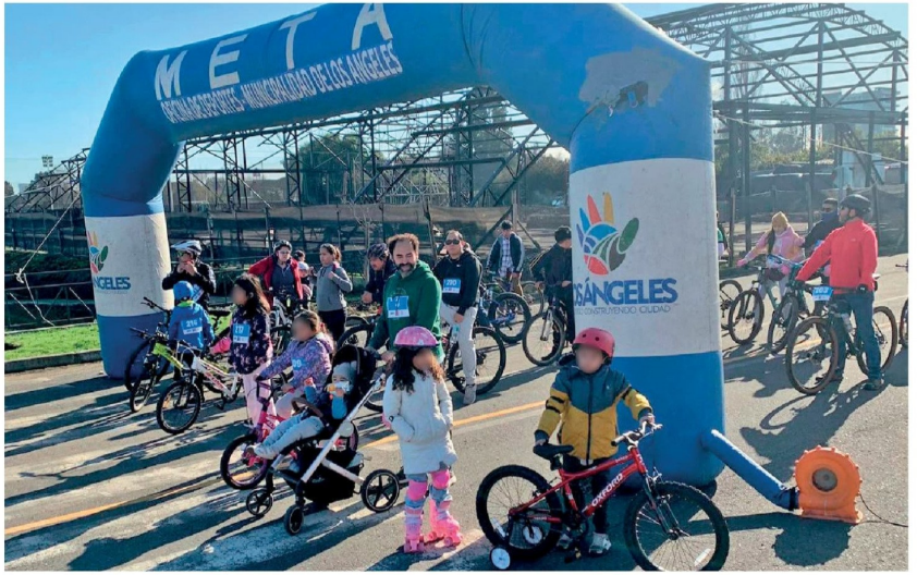
EN SU PRIMERA VERSIÓN la rodada de salud familiar convocó a decenas de participantes.

Según explicaron los profesionales, esta actividad consiste en realizar una ruta recreativa en cualquier vehículo con ruedas, sin motor, es decir, a tracción humana, como bicicletas, scooter, skate, sillas de ruedas, coches de bebé. "La idea es que este recorrido sea lo más inclusivo posible pues la actividad física es muy importante para todos y todas", apuntaron.