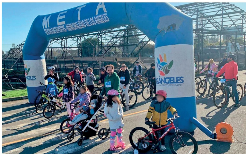
EN SU PRIMERA VERSIÓN la rodada de salud familiar convocó a decenas de participantes.

Según explicaron los profesionales, esta actividad consiste en realizar una ruta recreativa en cualquier vehículo con ruedas, sin motor, es decir, a tracción humana, como bicicletas, scooter, skate, sillas de ruedas, cochec de bebé. "La idea es que este recorrido sea lo más inclusivo posible pues la actividad física es muy importante para todos y todas", apuntaron.