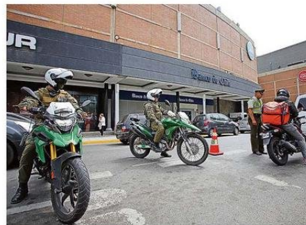
MUNICIPIO: "SE HAN INVERTIDO $3.600 MILLONES EN SEGURIDAD".