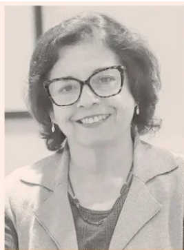
AURORA WILLIAMS MINISTRA DE MINERÍA.

fueron las importantes inversiones en minería y energía que se realizan en la región de Antofagasta, como el proyecto Nueva Centinela de Antofagasta Minerals, la desaladora de Codelco, la ampliación de Minera el Abra, el acuerdo entre