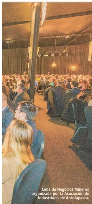
Cena de Negocios Mineros organizada por la Asociación de Industriales de Antofagasta.

fueron las importantes inversiones en minería y energía que se realizan en la región de Antofagasta, como el proyecto Nueva Centinela de Antofagasta Minerals, la desaladora de Codelco, la ampliación de Minera el Abra, el acuerdo entre