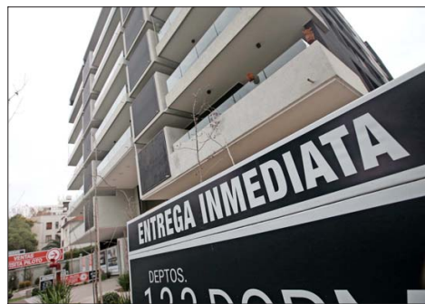
En el primer semestre de este año, las ventas de viviendas nuevas en la RM sumaron 11.097 unidades, disminuyendo 12% frente a igual lapso de 2023, según datos de la Cámara Chilena de la Construcción.

directamente relacionado al aumento de la inmigración en el país".