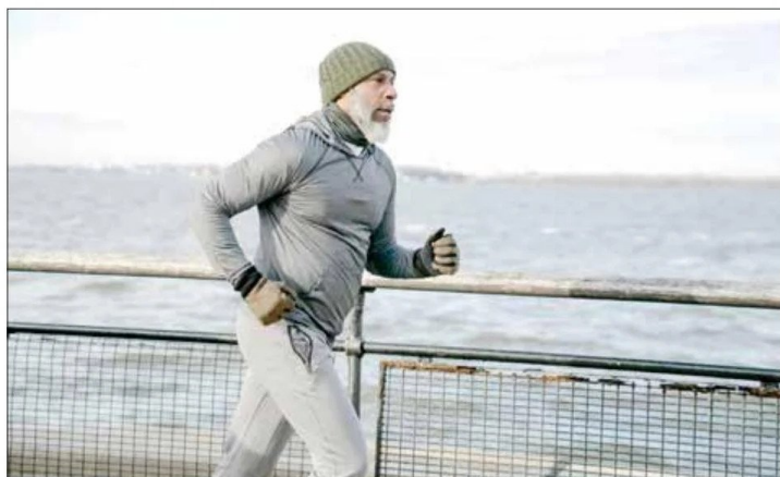
A juicio del experto, se puede disminuir hasta en un 80%, el riesgo de padecer alguna patología cardíaca, con desenlace fatal, solo con la prevención.