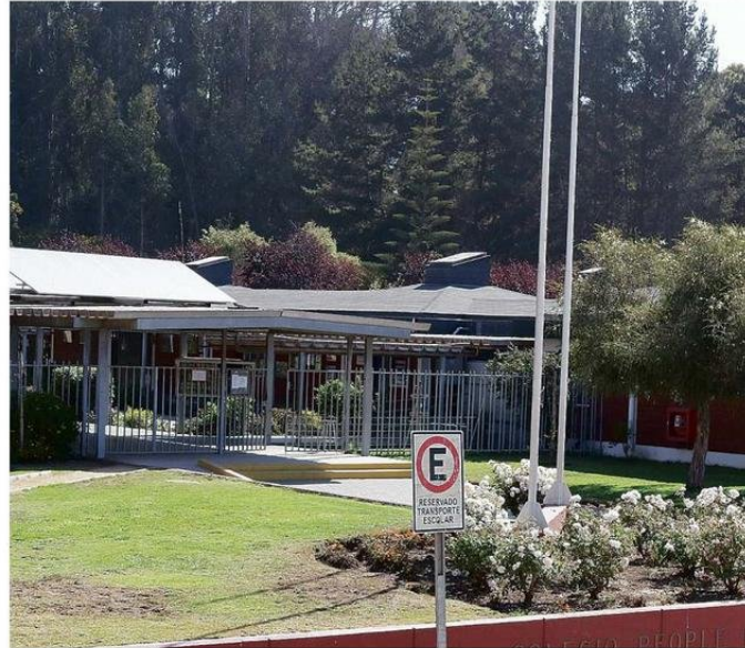
EL PEOPLE HELP PEOPLE ES UNO DE LOS COLEGIOS QUE DEPENDEN DEL MUNICIPIO DE SANTO DOMINGO.

El alcalde santodomingano destacó los buenos resultados educativos de Santo Domingo, precisando las labores que se realizan para fortalecer la educación pública en la comuna. “Estamos trabajando