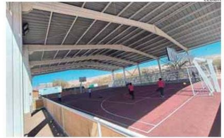
OBRAS TUVIERON UNA INVERSIÓN DE $62 MILLONES.