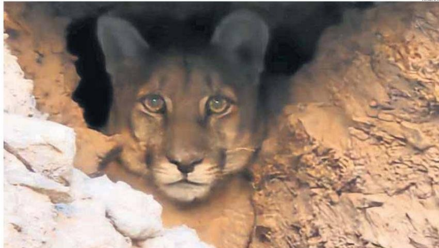
UNA DE LAS TANTAS IMÁGENES DEL AVISTAMIENTO DEL PUMA EN EL LOA, ESTA FUE EN EL SECTOR DE LA QUEBRADA DE AYQUINA EN 2023.