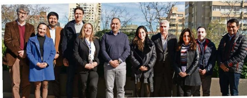
Integrantes de la mesa de coordinación editorial de “Valparaíso Región Sostenible”.