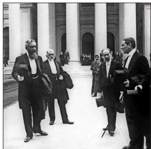
EL SUFRIDO CENTENARIO El centenario de la Independencia de Chile, en 1910, implicó un cuestionamiento sobre el desarrollo del país, pero también fiestas y jolgorios. Aquí aparecen el ministro Agustín Edwards Mac-Clure (a la derecha), quien también presidió la comisión del Centenario, y el senador Abdón Cifuentes (de bastón) recibiendo a los invitados al Congreso.