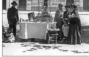
DULCES PARA NOCHEBUENA Para Navidad, una serie de puestos populares se instalaban en la Alameda. La feria, retratada hacia 1905, refleja la convivencia entre los palacios afrancesados de la Alameda con la cultura popular, más bien de raíz rural, que se expresa en la venta de cerámica pintada, faroles de papel, dulces caseros, mescaras y los "primos" o primeras frutas de la estación.