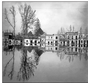
RINCONES DESAPARECIDOS DE SANTIAGO A partir de 1900, gracias a la simplificación de las cámaras y los sistemas de revelado, se multiplican en Chile los fotógrafos profesionales y aficionados. Incluso en 1911 se publica la revista "La fotografía chilena". El espacio público será uno de los focos de los fotógrafos chilenos, como esta imagen, tomada por Domínguez, de la antigua laguna del Parque Forestal.