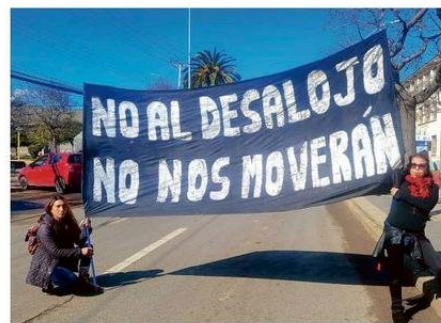
POBLADORES DICEN QUE NO SE ABORDÓ EL DESALOJO.

Ese es su origen y esto representa que sus condiciones de campamento se originan por una crisis en la política habitacional y falta de generación de oportunidades para obtener la vivienda o suelo".