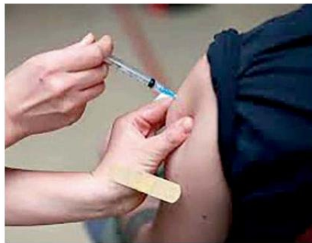
LA VACUNACIÓN ES PARA LOS GRUPOS ESPECÍFICOS.

"La transmisión persona a persona puede producirse por contacto estrecho con secreciones infectadas de las vías respiratorias (como hablar