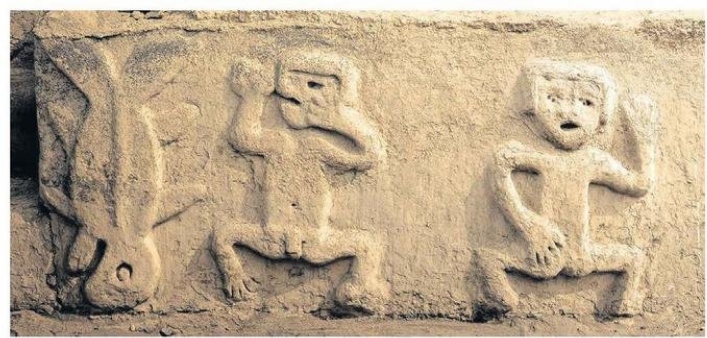
Las obras arqueológicas fueron nombradas 'La Danza de la Muerte y de la Vida'.

"Los resultados de esta investigación revelan una alta frecuencia de frutas (principalmente guayaba y lúcuma) y ajíes (entre ellos el ají amarillo) en los contextos analizados, lo que sugiere que estos frutos y especias eran habitualmente consumidos, utilizados en actividades ceremoniales y como parte de ofrendas", indicó.