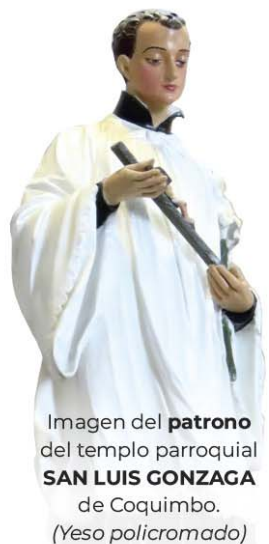
Imagen del patrono del templo parroquial SAN LUIS GONZAGA de Coquimbo. (Yeso policromado)