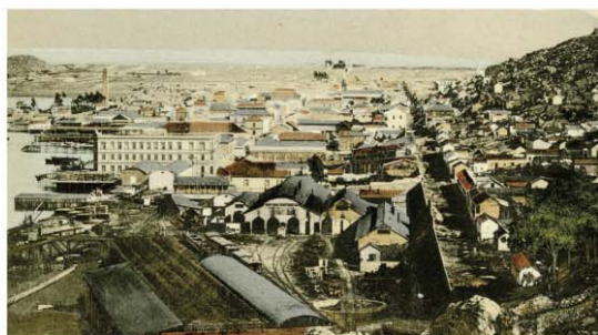
PUERTO DE COQUIMBO 1900

Actualmente, pertenecen a la parroquia las comunidades "Ntra Sra. de Lourdes" de Villa Dominante, "San Pablo" del Hospital de Coquimbo, "Inmaculado Corazón de María" de Guayacán y "Nuestra Sra. del Pilar" de La Herradura, además de los fieles del sector donde está emplazada la sede parroquial.