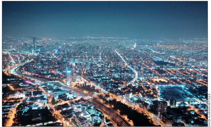
Se espera que la próxima semana se inicie la tramitación del proyecto que busca expandir a 4,7 millones los beneficiados por el subsidio eléctrico.

parte de la deuda con las generadoras. Ese cargo bajará a $9 por cada kWh entre 2028 y 2035. Este conjunto de reajustes, que afectan por ejemplo en la inflación, llevó al Gobierno a formular un proyecto de subsidios que comprometió ingresar a tramitación el 15 de agosto. Nuevas