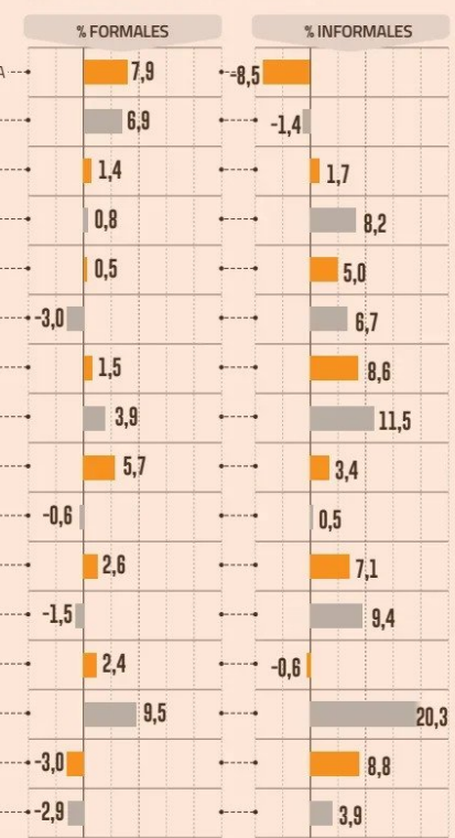
CRECIMIENTO ANUAL DE OCUPADOS FORMALES E INFORMALES POR REGIÓN AL II TRIM.

yor informalidad laboral estarían asociadas entre otros factores con mayores niveles de pobreza, menor escolaridad, mayor participación de ocupados en ramas de mayor informalidad como agricultura, comercio y construcción”, señaló el documento.