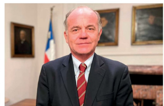
Antonio Walker, presidente de la Sociedad Nacional de Agricultura (SNA).