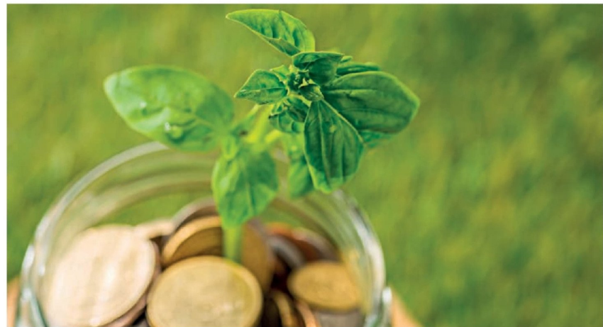
LA BAJA EN LA POSTERGACIÓN o liquidación de las inversiones agrícolas, según el gremio agrícola nacional, es una señal de mayor confianza en la actividad agrícola nacional.

En materia de seguridad, si bien reconoció el aporte del estado de excepción constitucional, y las leyes de usurpación y de robo de madera, advirtió que “las bandas de crimen organizado se desplazaron a los sectores rurales una vez que se creó el plan Calle Sin Violencia en las zonas urbanas. Por lo tanto, necesitamos un mayor despliegue policial urgente”.