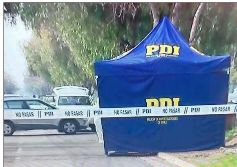
En la imagen, el hallazgo del fin de semana de un adolescente muerto con una bala en la cabeza al interior de un tambor en La Pintana.