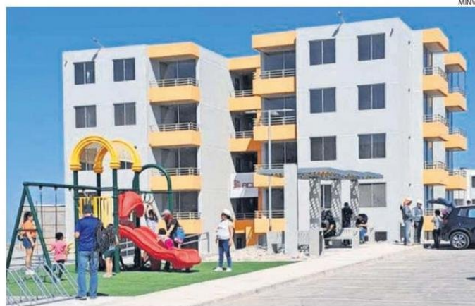
QUEDAN CASI 18 MESES PARA QUE EXPIRE EL PLAZO PARA LA ENTREGA DE VIVIENDAS.