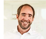
» Juan Andrés Errázuriz, CEO Enaex «

Apoyo a organizaciones comunitarias o juntas de vecinos durante los casi 40 años que Enaex ha estado en la comuna de Mejillones y más de 100 en Calama.