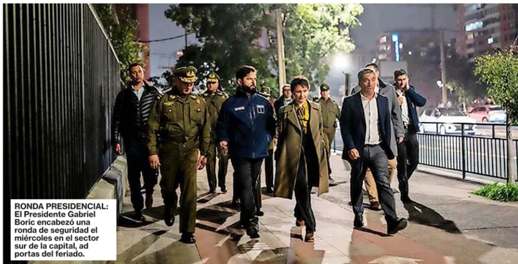
RONDA PRESIDENCIAL: El Presidente Gabriel Boric encabezó una ronda de seguridad el miércoles en el sector sur de la capital, ad portas del feriado.