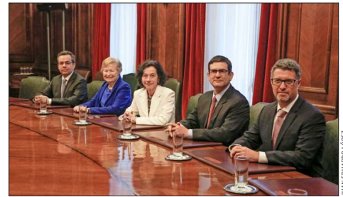
El Consejo del Banco Central decidió por la unanimidad de sus miembros rebajar en 50 puntos base la TPM.