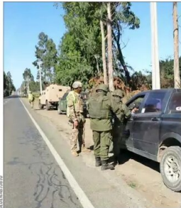
La vigilancia conjunta de carabineros y personal de las FF.AA. opera en las provincias del Biobío y La Araucanía.

> En cambio, las proyecciones de déficit de cobre llevan al alza el valor de la principal exportación nacional. Cochilco eleva su estimación a US$ 4,3 la libra para este 2024. | B 2