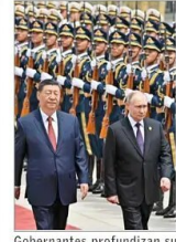
Gobernantes profundizan su "asociación estratégica".

El caso se origina luego de que se detectara que en el hospital se dio de alta a más de 320 mil interconsultas, muchas sin justificación. | C 4