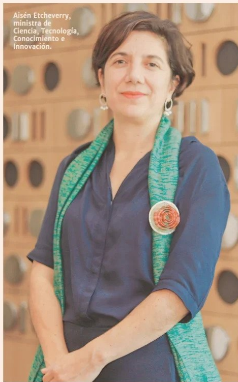
Aisén Etcheverry, ministra de Ciencia, Tecnología e Innovación.