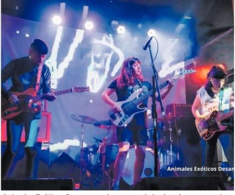
Animales Exóticos Desamparados es una de las bandas emergentes.