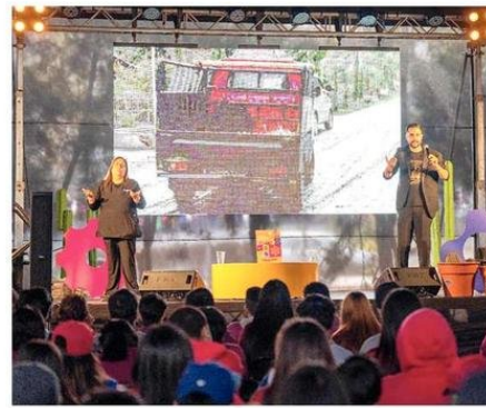
COMIENZA LA FIESTA DE LA CIENCIA.

El programa completo del Festival, presentado por Escondida | BHP, se encuentra disponible en puertodeideas.cl , mismo sitio donde se realizan las inscripciones y descarga de entradas gratuitas, para disfrutar de un fin de semana de entretenimiento y conocimiento en torno a la ciencia. 🌟